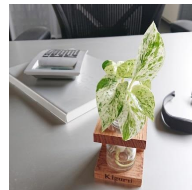
■ CE-003 KOKAGE-S

ガラス瓶にはキャップがついていまして倒れても水がこぼれにくい構造です。オフィスのデスク周りにもおすすめです。