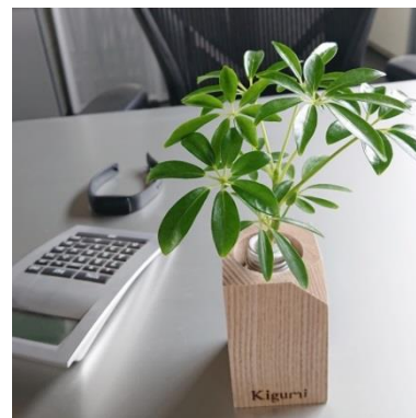
■ CE-002 TSUMIKI