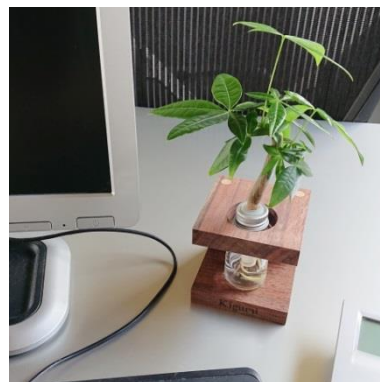
■ CE-004 KOKAGE-L

ガラス瓶にはキャップがついていまして倒れても水がこぼれにくい構造です。オフィスのデスク周りにもおすすめです。